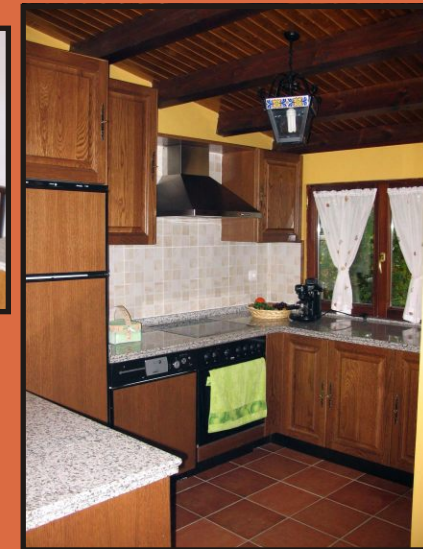
Cocina con muebles de roble y encimera de granito