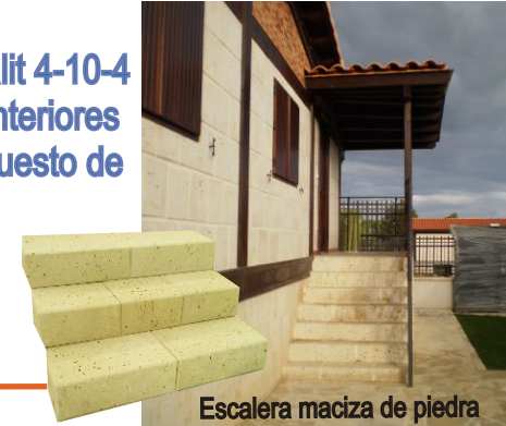
Escalera maciza de piedra

* Planta alta 40 m2 : Fachadas de piedra natural, teja cerámica, canalones color marrón, ventanas de iroko con climalit 4-10-4 y contraventana iroko, solados color cuero. Puerta de entrada maciza de Iroko con cierre de seguridad. Puertas interiores de pino estilo castellano con 5 plafones. Cubierta interior realizada en vigas de madera laminada vista, panel compuesto de hidrófugo de 19 mm, cámara de poliestireno extruido de 60 mm y friso de abeto de 10 mm visto. Calefacción por biomasa / pellets y radiadores de aluminio blanco. Pintura lisa en todas las estancias. Baño con mueble rústico, sanitarios en blanco tipo roca, alicatado parcial resto pintura. Escalera de caracol para acceso a la planta baja metálica con peldaños de madera. Distribución: Salón - cocina, 2 habitaciones y un baño.